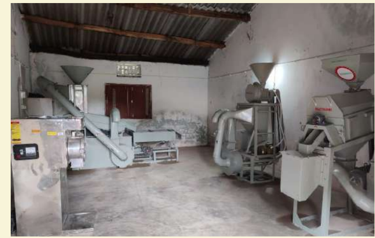
ଆଞ୍ଚଳିକ କୃଷକ ଉତ୍ପାଦନ ସଂଘ , କଳାହାଣ୍ଡି