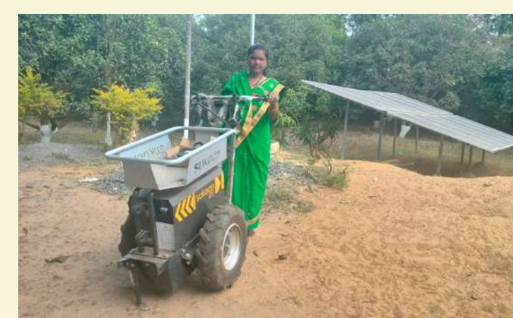
ସବୁଜିମା କୃଷକ ଉତ୍ପାଦନ ସଂଘ, କୋରାପୁଟ