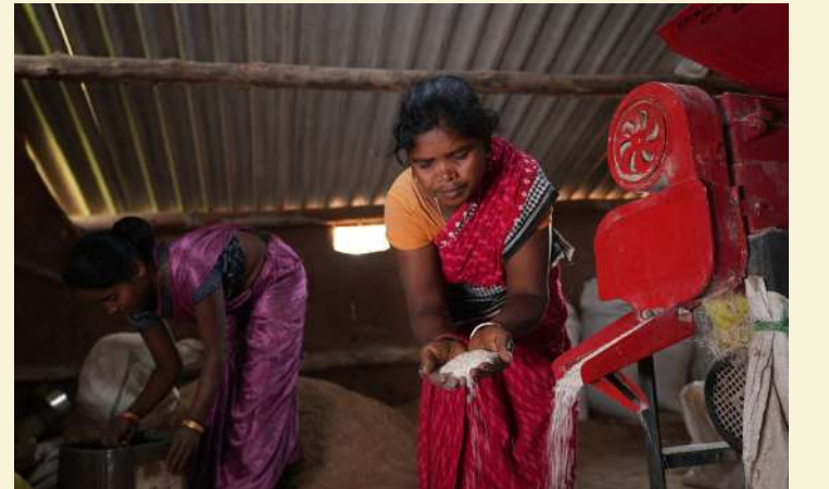
ଜୀବନ କୂପ ସ୍ୱୟଂ ସହାୟକ ଗୋଷ୍ଠୀ, କଳାହାଣ୍ଡି