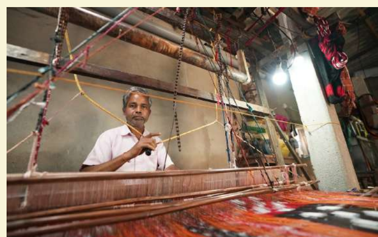
ଚନ୍ଦ୍ରପାଲି ବୁଣାକାର ସଂଘ , ସମ୍ବଲପୁର