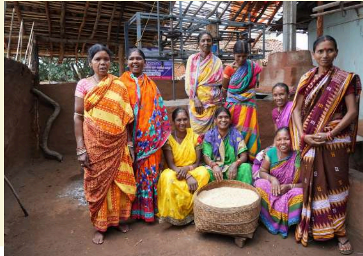
ସମଲେଶ୍ୱରୀ ସ୍ୱୟଂ ସହାୟକ ଗୋଷ୍ଠୀ, କଳାହାଣ୍ଡି