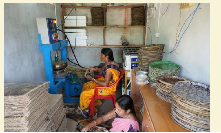
ସାଇବାବା ସ୍ୱୟଂ ସହାୟକ ଗୋଷ୍ଠୀ, କଳାହାଣ୍ଡି