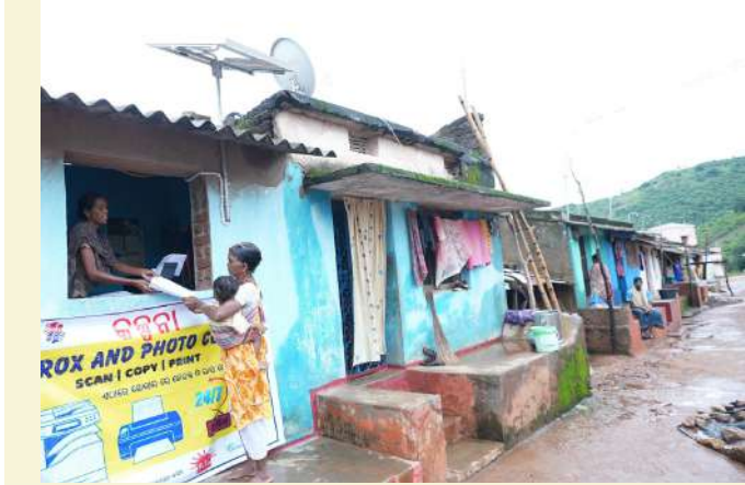
ମାତ୍ରୀ ମଦାଜି, ରାୟଗଡ଼ା