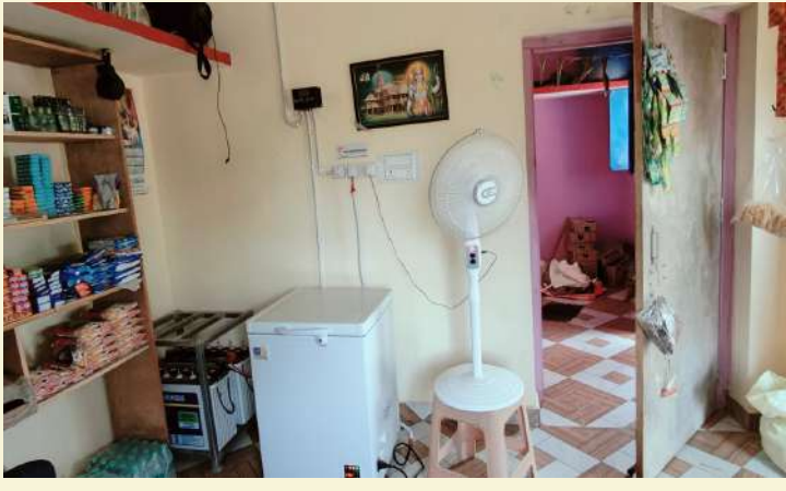
ପ୍ରେମ ବରିହା , କଳାହାଣ୍ଡି