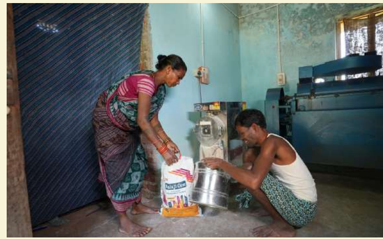
ମା ଡକାରୀ କୃଷକ ଉତ୍ପାଦନ ସଂଘ , କଳାହାଣ୍ଡି