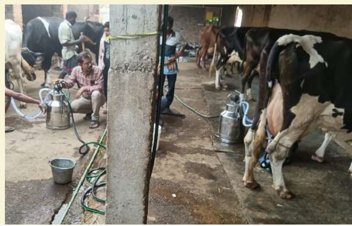
ଚୁଲେଶ୍ୱରୀ ନାୟକ , ସମ୍ବଲପୁର